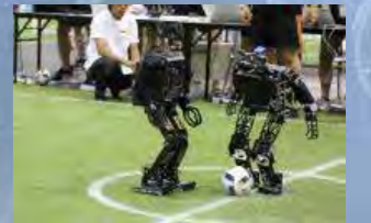
ロボットによるサッカー競技。

主催 ロボカップアジアパシフィック2020あいち開催委員会 (会長:愛知県知事) ロボカップアジアパシフィック委員会